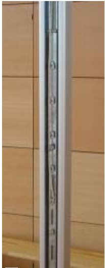
Ein Ständer ist nur zum Einhängen