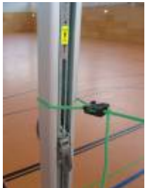
ein Ständer ist zum Festspannen