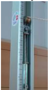
Skalierung am Ständer